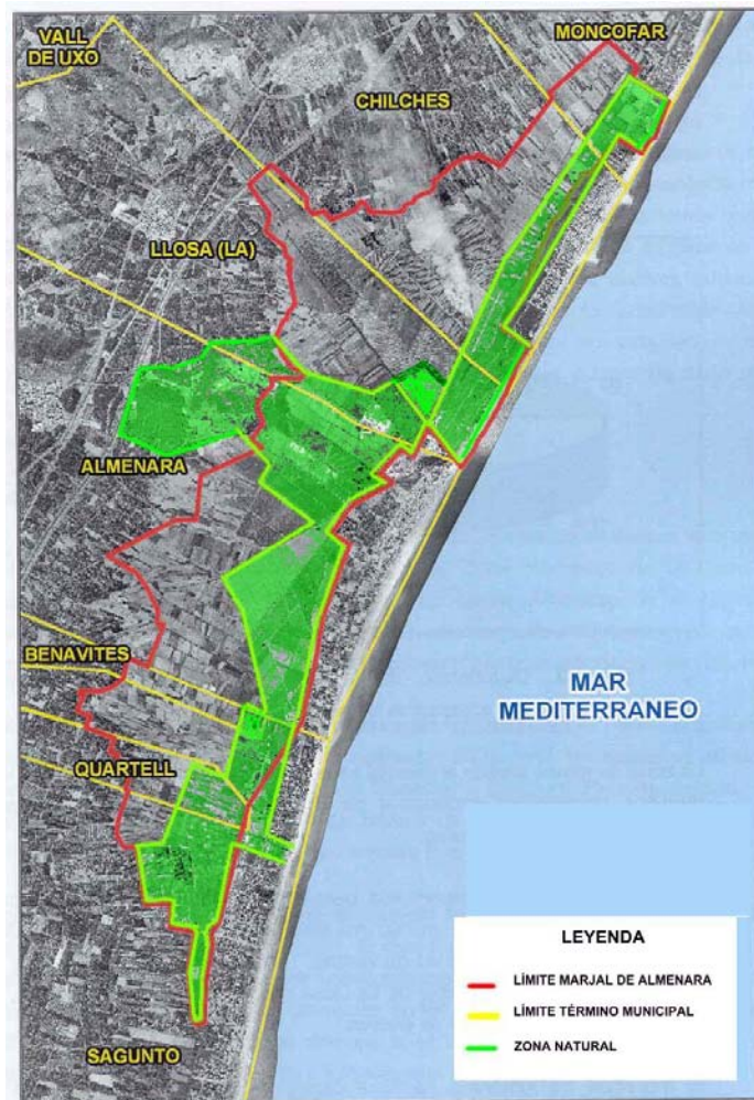
MAPA I. ZONIFICACIÓN RECOMENDADA