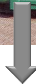
Compactador de Envases