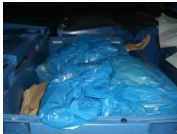
» Contenedor Papel/Cartón