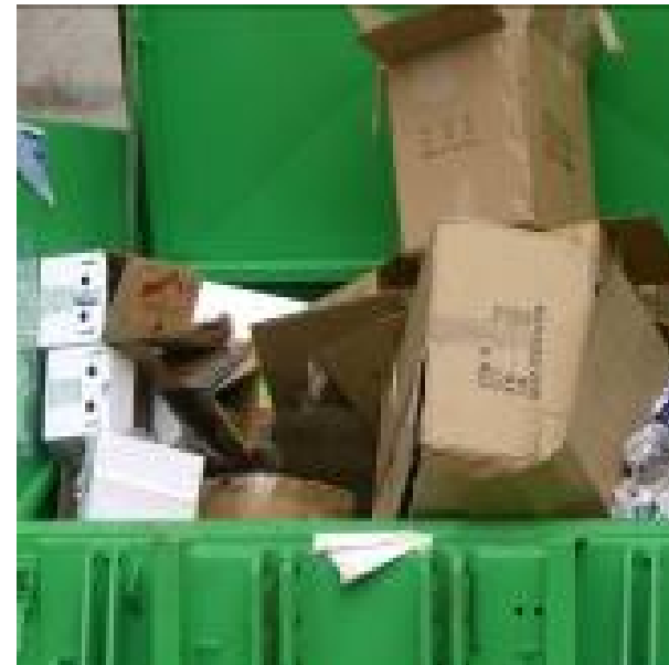
» Compactador Papel/Cartón