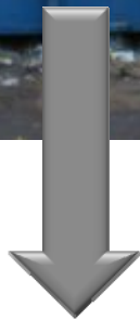
Contenedor de resto