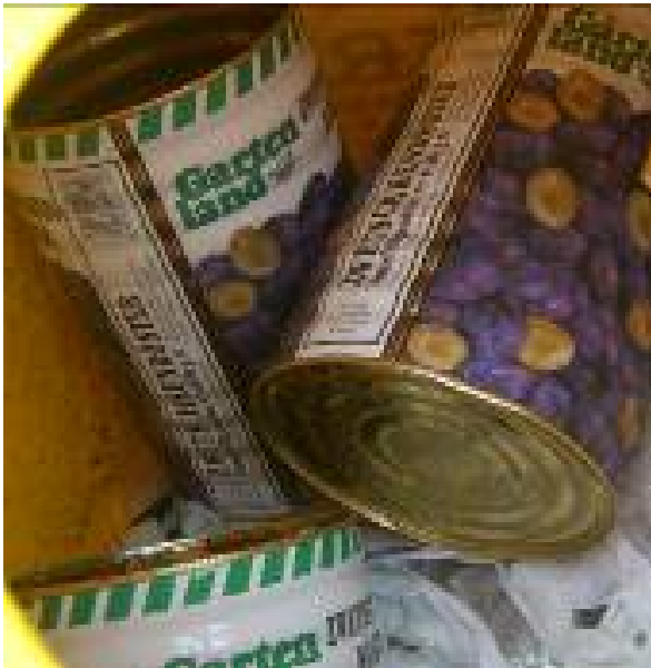
» Contenedor Envases