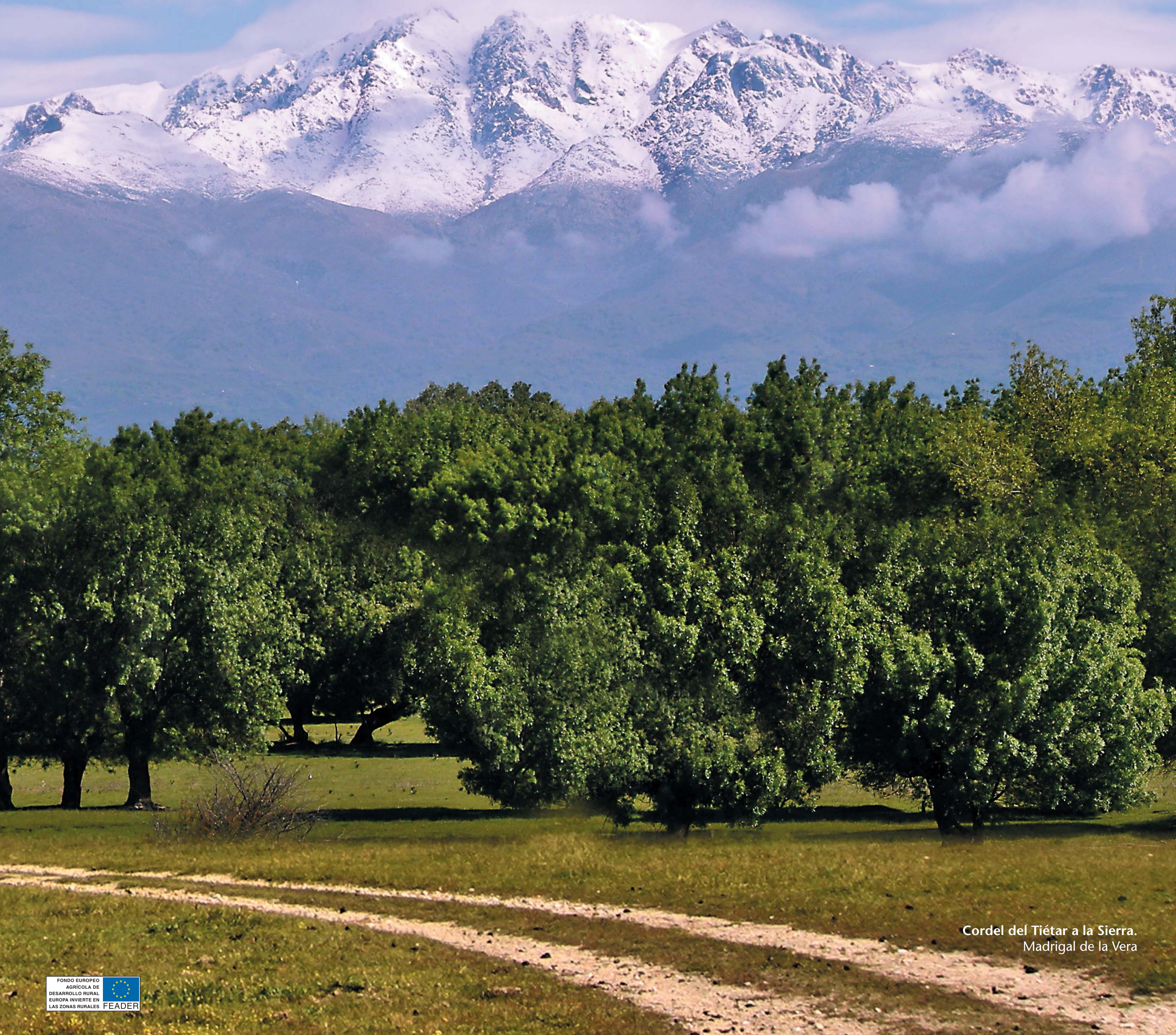
Cordel del Tíetar a la Sierra. Madrigal de la Vera