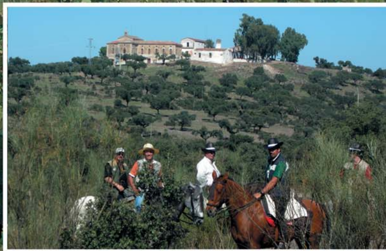
Turismo equestre. Cordel de Cáceres Trujillo