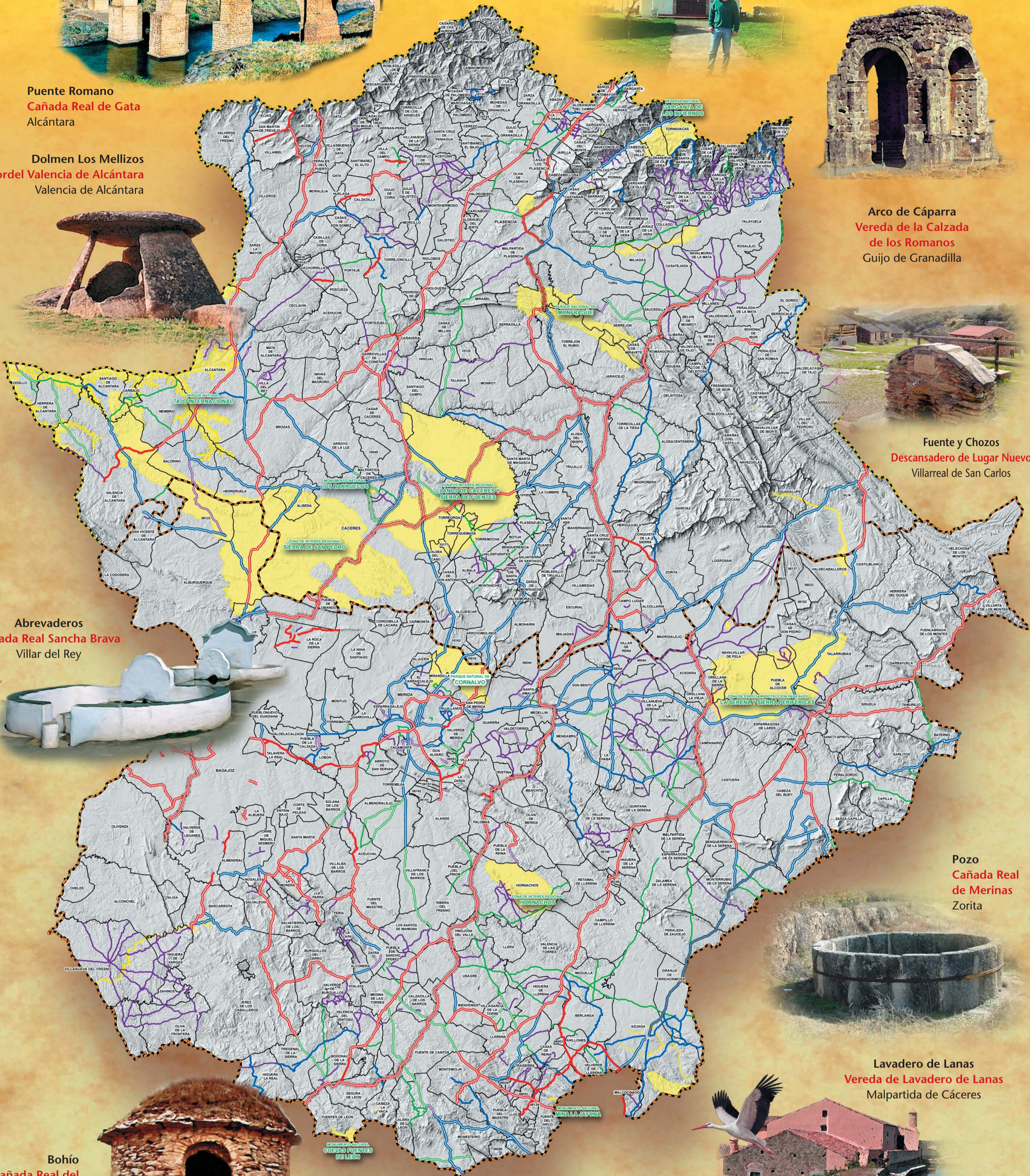
Abrevaderos Cañada Real Sancha Brava Villar del Rey