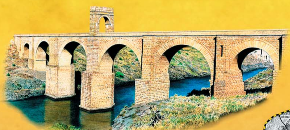
Puente Romano Cañada Real de Gata Alcántara