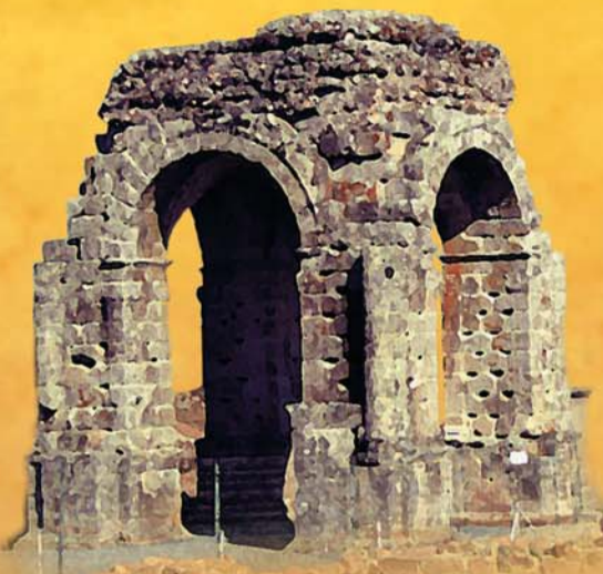
Arco de Cáparra Vereda de la Calzada de los Romanos Guijo de Granadilla