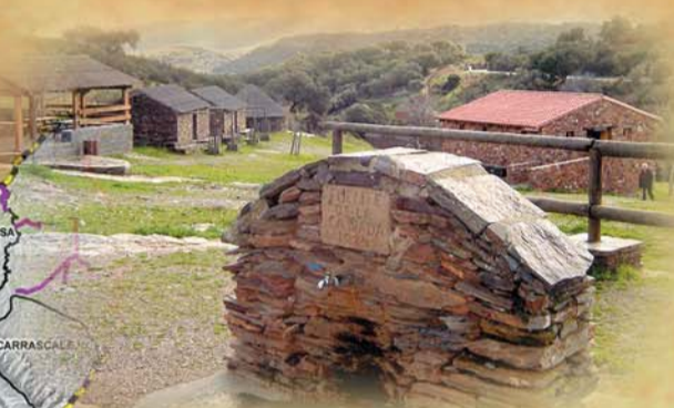
Fuente y Chozos Descansadero y Lugar Nuevo Villarreal de San Carlos