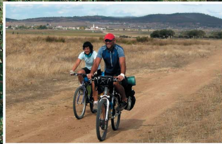
Cicloturismo. Cordel de Mérida Cáceres