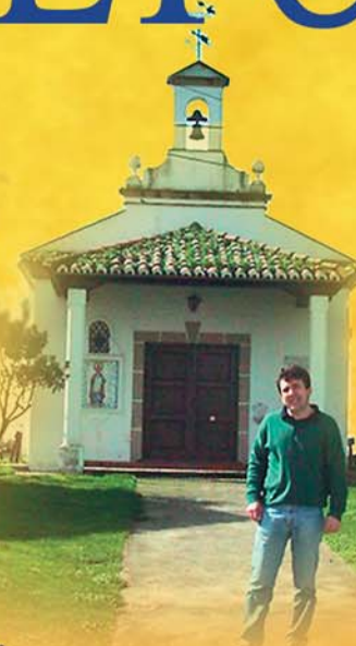
Ermita de San Blas Cordel de Plasencia Toril