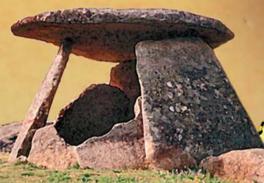
Dolmen Los Mellizos Cordel Valencia de Alcántara Valencia de Alcántara