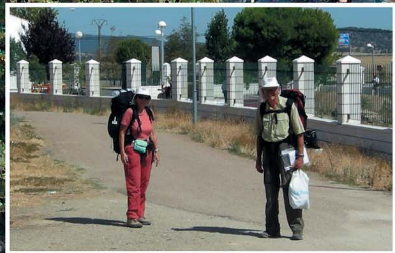
Senderismo. Cañada Real del Casar Valdesalor (Cáceres)